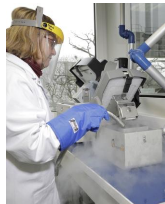
Extraction d'ARN au CEA-Genoscope