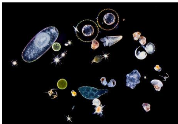
Protistes et larves planctoniques